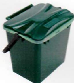
FAST, LUKKET KØKKENSPAND >>