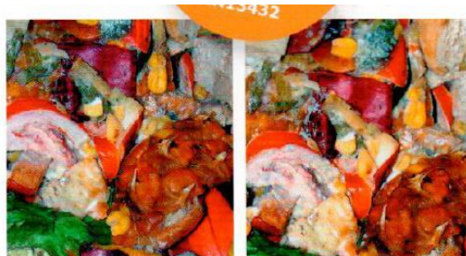
DAG 4 Posen er stadig tør. Ingen tegn på mug.