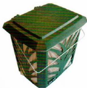
VENTILERET KØKKENSPAND >>