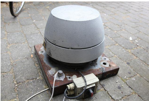
Tagventilator , Den kraftige type. Sælges for kr. 150.