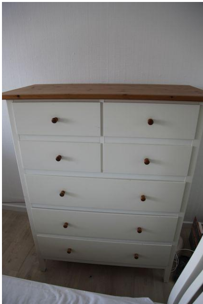
Kommode , IKEA, BxHxD: 100x125x49 cm. Sælges for kr. 150.

Termorude , klasse A+, uden ramme (til loftsvindue på 1. sal), 95x45 cm. Sælges for kr. 150